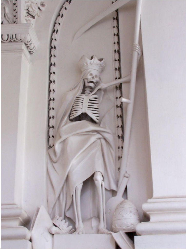
死亡之舞 Danse Macabre: